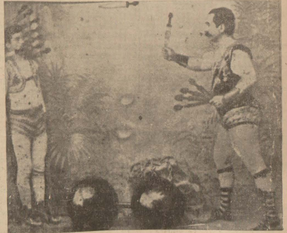
Bay Rızanın Abdülhamit devrinde bastırılmış kartpostallarından biri

250 libre yüklü, dört tekerlekli arabayı dişlerimle çekmemi istediler. Bir Alman mecmuasında görmüşlerdi. Çektim, bu benim en müşkül oyunumdur.