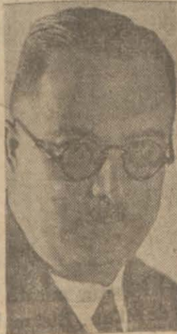
Kütahya valisi Sedat Erim

Kütahya ve Si-mav kaza mer-kezlerle Sapha-ne nahiye mer-kezinde başla-tılan bugünün ihtiyacına uygun mektep binaları inşaatı bitirmek üzere-dir. Bu bina-lar. Memleketin bu alandaki yoksullu-