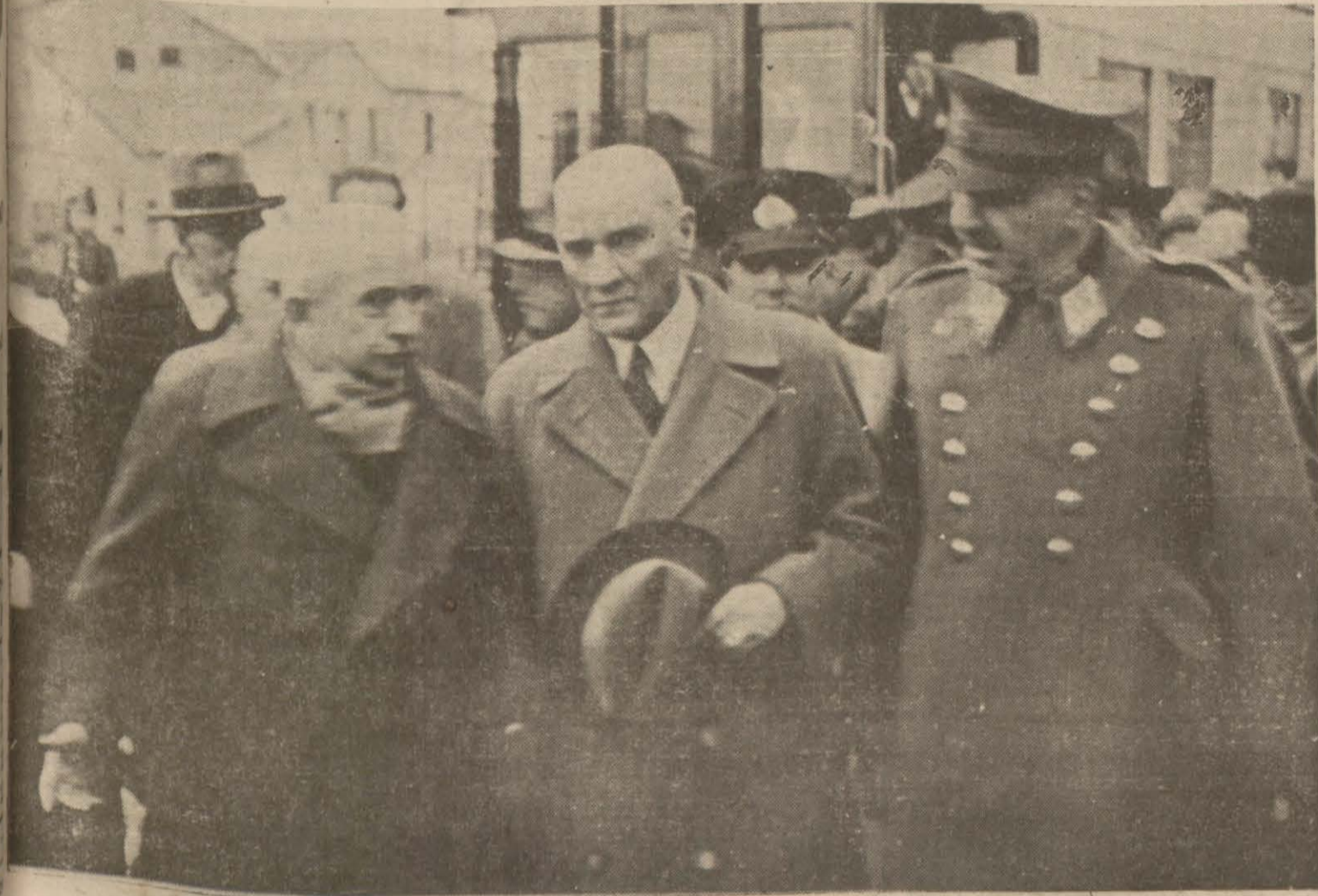
Atatürk Ankaraya muvazaatlerinde İsmet İnönü ile görüşürlerken

Başvekil davamızın yegâne müsbet hal yolunu gösterdi