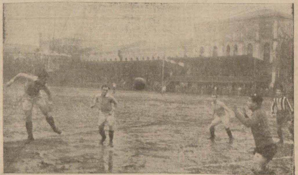
Dünkü maçtan bir enstantane

Romanyahlar çok sert oynadılar, bizim takımımız vasat bir oyun dahi gösteremedi. Oyuncuların birbirleriyle anlaşamadıkları belli oluyordu.