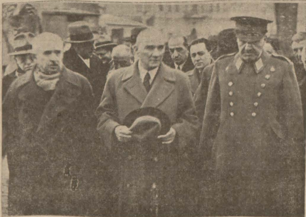
Atatürk Ankara istasyonunda

Fransızca Tanın makalesi Ankarada bedbini ile karşılandı